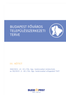
Budapest Főváros Településszerkezeti Terve