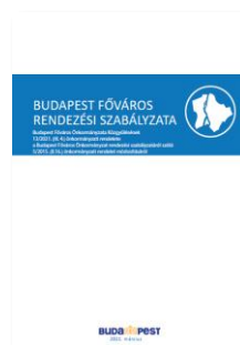
Budapest Főváros Rendezési Szabályzata