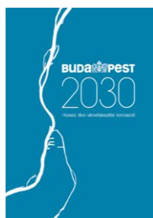
Budapest 2030 Városfejlesztési Koncepció

Ennek megfelelően a Budapest 2030 hosszú távú településfejlesztési koncepciót és az Otthon Budapesten integrált településfejlesztési stratégiát az új fővárosi településfejlesztési terv váltja fel, a településszerkezeti terv (TSZT), mint terműfaj megszűnik, de a fővárosi önkormányzat által jóváhagyandó fővárosi rendezési szabályzat (FRSZ), az új jogszabályi környezetnek megfelelő tartalommal a településrendezési terv része marad.